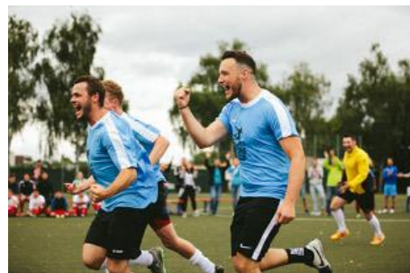
Ausgelassen feierten die „Young Professionals“ von Steigtechnikhersteller Hymer-Leichtmetallbau ihren verdienten Sieg beim EHG-Cup 2017.