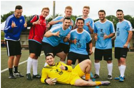
Brachten den EHG-Cup 2017 nach Wangen: Die „Young Professionals“ von Steigtechnikhersteller Hymer-Leichtmetallbau.