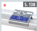
Klemmbeschlagset für Treppenstellung