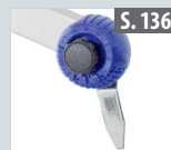
Fußspitzenset für Traversen