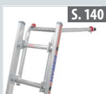
Wandabstandshalter für Sprossenleitern