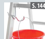
Eimerhaken für Sprossenleitern