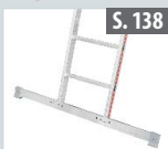
Traverse für Leiterteil zum Nachrüsten