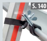
Leiterhaltersset für Dachrinnen