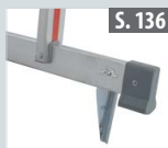
Fußspitzenset für Traversen