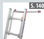
Wandabstandshalter für Sprossenleitern