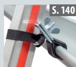
Leiterhaltersset für Dachrinnen