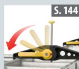
Leiterhaltersset für Dachträger