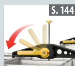
Leiterhalterset für Dachträger