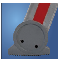
Sabots antidérapants en plastique