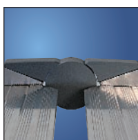
Articulations pouvant être remplacées