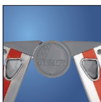
Articulation en acier avec cache en plastique