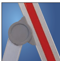
Bisagras de acero revestidos