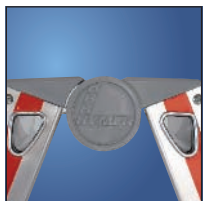
Articulación de acero con cubierta de plástico