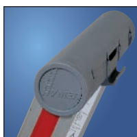
Repisa funcional de gran tamaño, abatible