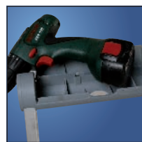
Repisa para depositar las herramientas con seguridad