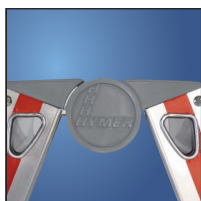
Stahlgelenk mit Kunststoffabdeckung