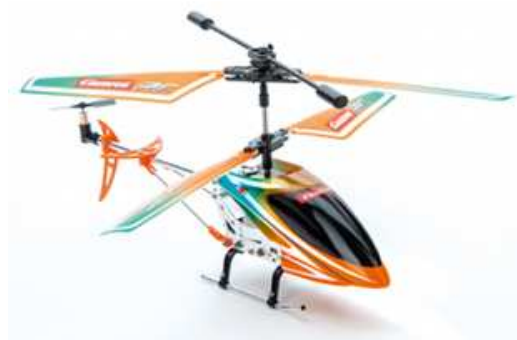
Beigabe: ferngesteuerten Carrera-Helikopter Modell „Orange Sply“