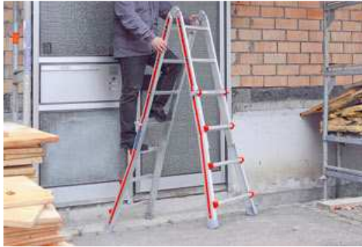
Die Teleskopleiter „Telestep®“ Modell 4042 von Hymer-Leichtmetallbau im Einsatz