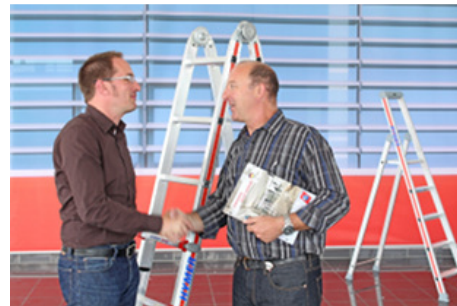
Grund für hohe Zufriedenheit: Die Kunden von Hymer-Leichtmetallbau loben die Fachkompetenz der Mitarbeiter wie auch die Qualität der Betreuung.