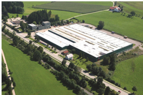
Sicht auf das Werk des süddeutschen Aluminiumspezialisten Hymer-Leichtmetallbau in Wangen.