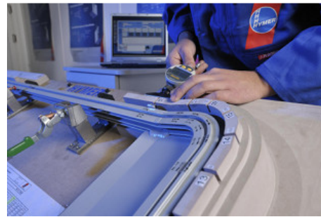
Qualitätsmanagement und Sicherheitsbewusstsein stehen bei Hymer-Leichtmetallbau an erster Stelle.