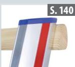
Traverse für Leiterteil zum Nachrüsten