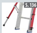
Nachrüstset Ausleger teleskopierbar