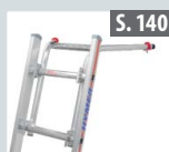
Wandabstandshalter für Sprossenleitern