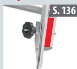
Fußspitzenset für Holme