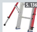
Nachrüstset Ausleger teleskopierbar