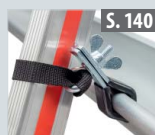
Leiterhalter-set für Dachrinnen